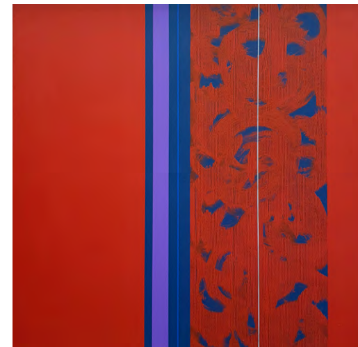
„Hommage à Lüscher – červená“ akryl na plátně, 100 x 100 cm