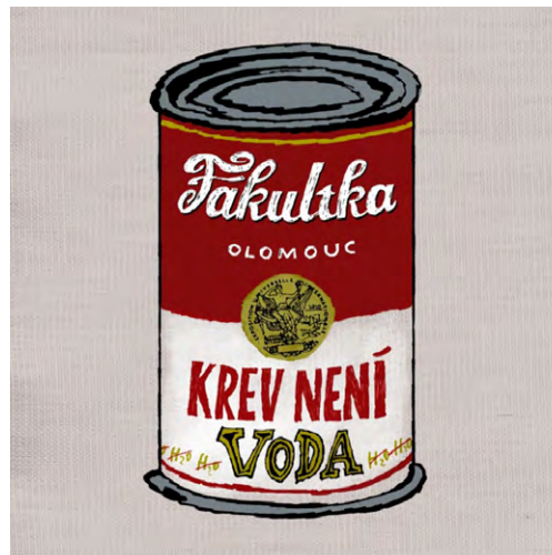
„Krevní konzerva“, cyklus „Krev není voda“ tisk na plátně, 90 x 90 cm